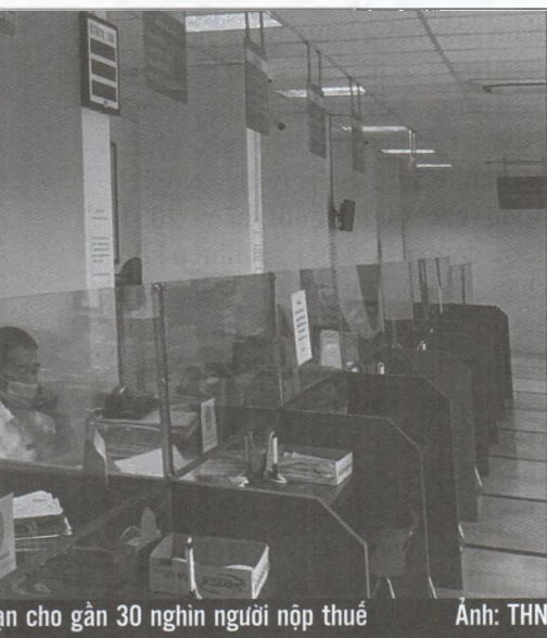
an cho gần 30 nghìn người nộp thuế

Cùng với đó, cơ quan thuế tiếp tục hỗ trợ DN và NNT thực hiện tốt các dịch vụ thuế điện tử, dịch vụ công trực tuyến, cũng như đẩy mạnh triển khai nộp điện tử lệ phí trước bạ ô tô xe máy; tăng cường các phương thức thanh toán không dùng tiền mặt đối với NNT khu vực cá thể, tăng cường các ứng dụng trên nền tảng thiết bị di động (app) để tạo thuận lợi cho công dân khi giao dịch về thuế và thực hiện đồng bộ các giải pháp để triển khai tốt cơ chế “một cửa liên thông”, tiến tới “một cửa liên thông điện tử”; kết nối, tạo cơ sở dữ liệu tập trung, phục vụ tốt cho công tác quản lý, chỉ đạo, điều hành của các cấp, ngành và của TP ■