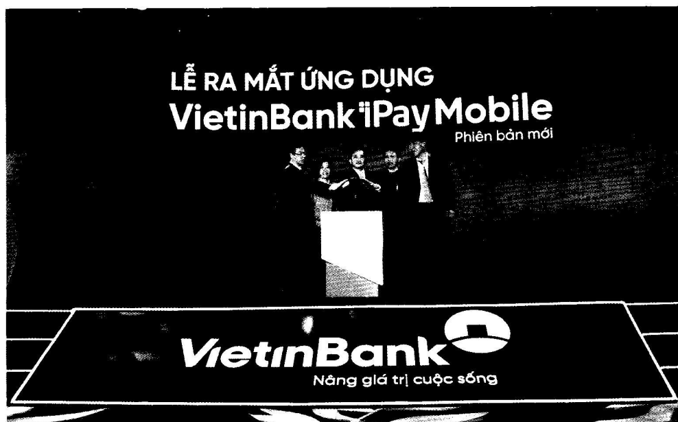
Lễ ra mắt ứng dụng VietinBank iPay Mobile phiên bản mới (năm 2019)

thông, than - khoáng sản, điện, hóa chất, sắt thép, xi măng, vận tải...; cung ứng tài chính cho nhiều doanh nghiệp thuộc ngành hàng xuất khẩu, góp phần thực thi chiến lược tăng trưởng xuất khẩu như: Dệt may, da giày, nuôi trồng, chế biến thủy hải sản, nông lâm sản... trên phạm vi cả nước. Đối với doanh nghiệp nhỏ và vừa, VietinBank cũng mở rộng đầu tư vốn, được công nhận là ngân hàng đầu tiên xây dựng các dự án, các cơ chế cho vay và là một trong những ngân hàng mạnh nhất trong cung cấp dịch vụ tài chính với phân khúc này, được nhiều tổ chức quốc tế lớn như JBIC, EC, KFW, ADB... tín nhiệm tài trợ vốn.