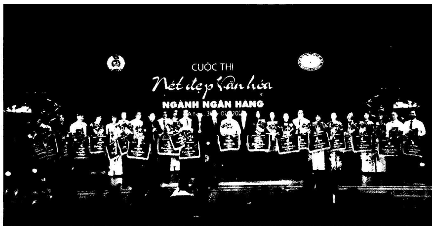
Đại diện 24 đội tham gia Cuộc thi "Nét đẹp văn hóa ngành Ngân hàng"

- Phối hợp tuyên truyền trên các báo, tạp chí trong và ngoài Ngành như: Thời báo Ngân hàng, Tạp chí