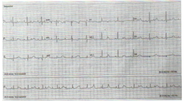
Hình 2. Điện tâm đồ sau sinh ghi nhận rối loạn dẫn truyền block nhĩ thất độ 3

Ở tuần thai thứ 33, bệnh nhân đã được mổ đẻ sinh non và sinh ra một bé gái nặng 2700 gam. Nhịp tim lúc mới sinh là 60 nhịp/phút và điểm APGAR lúc 1 phút và 5 phút lần lượt là 7 và 9. Sau khi sinh tại NICU, cháu bé đã ổn định với thở oxy phòng với nhịp tim 60 nhịp/phút. Điện tâm đồ cho thấy nhịp tim 54 nhịp/phút và siêu âm tim không cho thấy bất kỳ bất thường nào về cấu trúc (Hình 2). Để cẩn thận hơn, các bác sĩ tại bệnh viện chuyên khoa Tim mạch Nhi đã đeo Holter ĐTD 24h và ghi nhận kết quả giống như khi siêu âm tim trước sinh (Hình 3). Bé được xuất viện sau một tuần và được theo dõi cẩn thận hàng tuần. Đến thời điểm này là 2 tháng sau khi sinh em bé vẫn chưa cần đặt máy tạo nhịp tim.