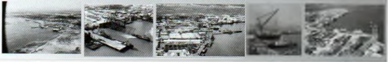
MÔ LỰC PHÂN ĐÁU, CẢNG DỊCH VỤ DẦU KHÍ - XÍ NGHIỆP DỊCH VỤ KHÔNG NGỪNG ĐƯỢC NÂNG CẤP MỜ MỜNG VÀ HIỆN ĐẠI HÓA DƯA THỜI GIAN ĐỂ HÌNH THÀNH CỤM CẢNG DỊCH VỤ HIỆN ĐẠI PHỤC VỤ HOẠT ĐỘNG KHAI THÁC DẦU KHÍ KHÔNG CHỈ CỦA LIÊN DOANH VIỆT - NGA VIETSOVPETRO MÀ CÒN BỔ HỮNG PHỤC VỤ CÁC ĐỐI TÁC TRONG VÀ NGOÀI NƯỚC, GÓP PHẦN QUẢN TRỊ CHO SỰ PHÁT TRIỂN CÔNG NGHIỆP HÓA HIỆN ĐẠI HÓA NGHÀNH DẦU KHÍ VIỆT NAM.