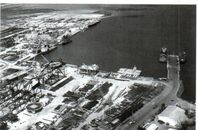
CẢNG VIETSOVPETRO NGÀY NAY