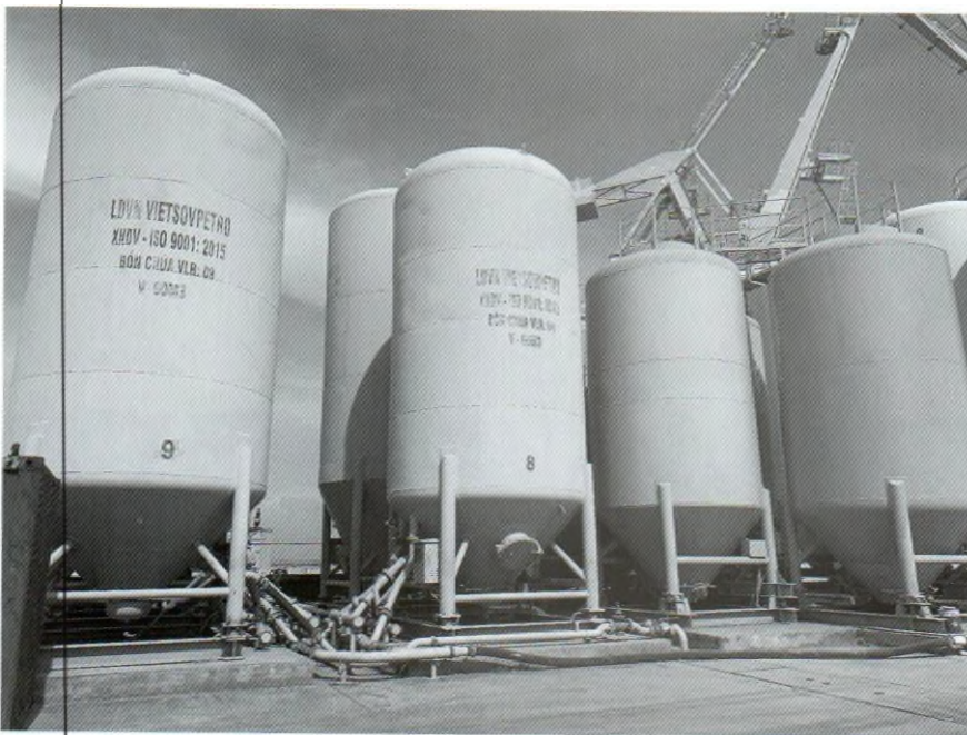
Hệ thống bơm vật liệu rời.

đạt thành tích cao về công tác an toàn trong 5 năm, từ 2005 - 2010". Năm 2011 đã được Tổng Giám đốc Vietsovpetro tặng cờ "Tập thể có đóng góp tích cực vào thành tích của Vietsovpetro trong công tác ATSKMT", cờ của "Công đoàn Liên doanh Việt - Nga Vietsovpetro tặng Đội AT - VSV đạt giải khuyến khích trong hoạt động năm 2011".