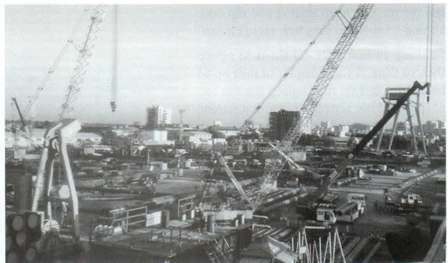
Khu vực Căn cứ tổng hợp trên bờ năm 2015.

Hàng năm, Xí nghiệp Dịch vụ đều tham gia đề xuất sáng kiến sáng chế và được Hội đồng sáng kiến sáng chế và Khoa học công nghệ Vietsovpetro công nhận.