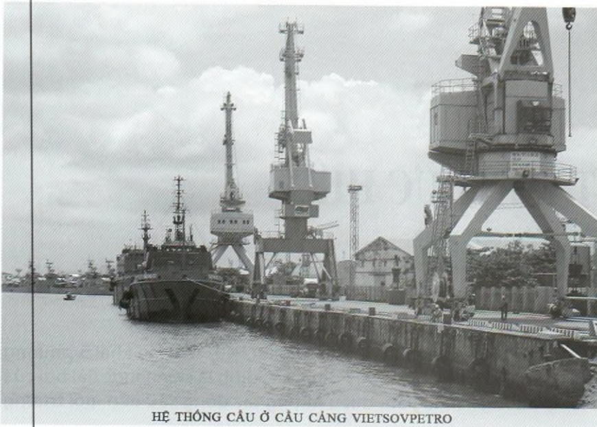
HỆ THỐNG CẦU Ở CẦU CẢNG VIETSOVNETRO