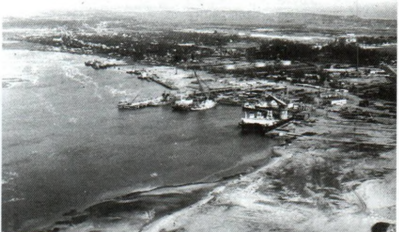
CẢNG VIETSOVPETRO TRƯỚC ĐÂY