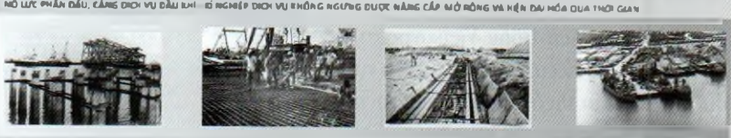
BỘ TRƯỞNG ĐINH ĐỨC THIỆN CÙNG CÁC ĐỒNG CHÍ CÁN BỘ NGÀNH DẦU KHÍ KHẢO SÁT, TÌM ĐỊA ĐIỂM SẴY ĐUNG CÁN CỬ PHỤC VỤ KHAI THÁC DẦU KHÍ NĂM 1981. Binh đoàn 318-Bộ Quốc Phòng triển khai san lấp mặt bằng để xây dựng khu Cảng dầu khí đầu tiên của Việt Nam. Khu Cảng dầu khí đầu tiên của Việt Nam đi vào hoạt động là niềm tự hào của XN Liên doanh và cả nước.