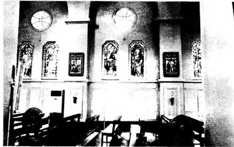
Tranh kính trang trí phía hông bên trái Thánh đường nhà thờ Cửa Bắc

Trong một số tác phẩm tại nhà thờ Lớn Hà Nội, mặc dù màu sắc dưới hiệu ứng của ánh sáng trong trẻo và sắc nét nhưng những đường nét bao quanh nhân vật, hình thể nhân vật chính lại là những đường nẹp chì rất to, thô cứng, cộng thêm đường nét chạy ngang chịu lực cho các mảnh kính nhỏ bên trong khiến cho tổng thể bức tranh trông khá nặng nề, bức bối. Cũng kỹ thuật đó, cặp tranh tại Cung Thánh của nhà thờ Hàm Long vẽ về các Thánh Louis và Thánh Elisabeth De Hongrie (Thánh Elisabeth nước Hungary) có nét nẹp chì thanh thoát hơn hẳn. Mái tóc của Thánh Louis vốn là vua nước Pháp được mô tả mềm mại, duyên dáng, đúng nguyên mẫu của đàn ông quý tộc Pháp. Tấm áo choàng của Thánh Elisabeth De Hongrie, với những đường nẹp chì thanh mảnh, uốn lượn quanh hình thể nhân vật, khiến người xem có một cảm giác chiếc áo đó rất nhẹ và mỏng manh. Tổng thể của cặp tranh này mang lại cho người xem một sự