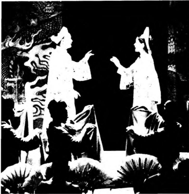
Cảnh trong vở Rồng - Phượng Nhà hát Chèo Việt Nam