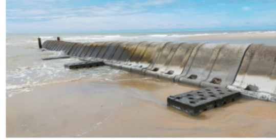
(b) Phương án mô hàn dạng vòm - Làng Chài