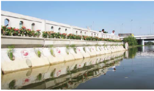
(a) Kè Rạch nước lên - TP Hồ Chí Minh

dự án AquaDONA đã sử dụng đệm đá học dưới hộp kè.