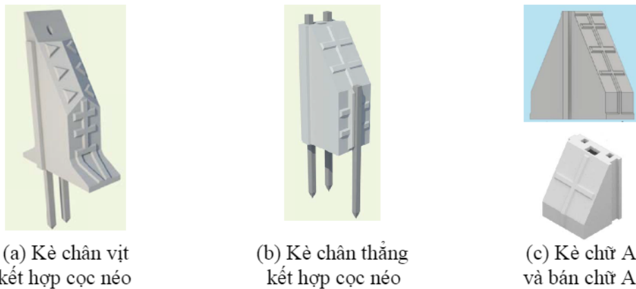
Hình 2. Các dạng kè hộp cho bảo vệ bờ biển