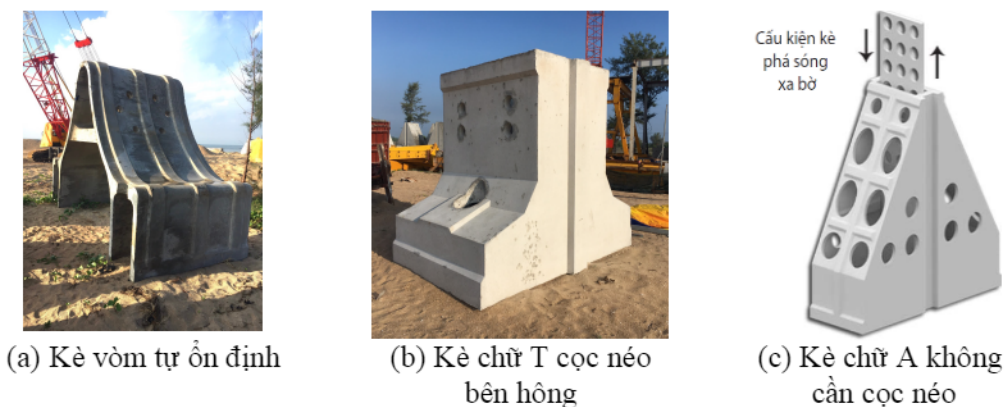
Hình 3. Cấu kiện cho mô hàn và đập giảm sóng