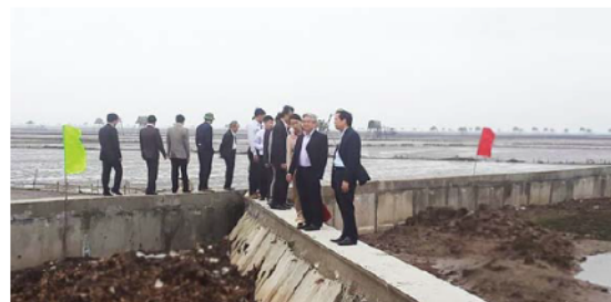
(b) Kè biển Tiên Hải - Thái Bình