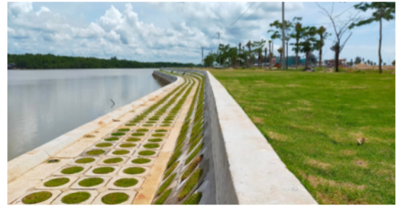
(b) Kè bờ sông Ray, Phước Thuận, Xuyên Mộc