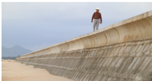
(a) Kè biển Khu du lịch Làng Chài - Vũng Tàu

cấu kiện với nền. Để tăng độ cứng của thành hộp kè, ngoài việc tăng chiều dày thành kè, còn phải gia cường thêm các gân chịu lực tại các biên của hộp và bề mặt hộp kè. Các gân gia cường chẳng những đã tăng thêm thẩm mỹ mặt kè, mà còn có tác dụng giảm năng lượng sóng khi tiếp xúc bề mặt kè. Chân kè được bảo vệ bằng thảm đá, ngoài biên thảm được giữ bằng các rọ đá dạng hộp BTCS. Kết cấu này đã khắc phục được những tồn tại mà rọ đá truyền thống không bền lâu khi làm việc trong môi trường nước biển, nước lợ, nước xâm thực.