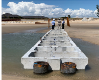
(a) Phương án mô hàn dạng hình Chữ T

trình này đã được mô tả trong hình 3. Trong đó, kết cấu dạng hộp hình chữ T phù hợp cho chiều cao đập yêu cầu lớn, dạng cung vòm rất phù hợp cho kè ngầm hoặc mô hàn có yêu cầu chiều cao không lớn.