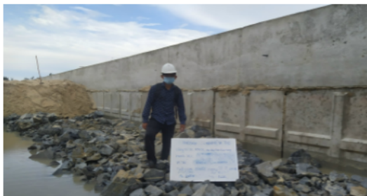
(c) Kè biển Quê Hương - Bình Thuận - nghiệm thu bộ phận