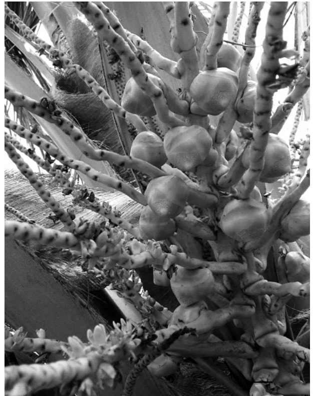
Hình 1. Sự trùng pha giữa hoa đực và hoa cái ở cây dứa Dứa (M: hoa đực, F: hoa cái)

Theo Tôn Thất Trình (1974), sự tượng hoa cái xảy ra khoảng 15-16 tháng trước khi hoa nở. Thực tế, lượng mưa trong những tháng mùa khô rất thấp. Do đó, có thể nói sự giảm số lượng hoa cái trong mùa mưa ở cây dứa Dứa là do sự thiếu hụt nước trong mùa khô năm trước đã ảnh hưởng đến sự hình thành hoa cái. Ngược lại, vào mùa mưa năm trước, cây dứa Dứa được cung cấp đầy đủ nước giúp sự vận chuyển và hấp thu chất dinh dưỡng thuận lợi hơn cho sự hình thành hoa cái dẫn đến số hoa cái xuất hiện trong mùa khô cao hơn so với mùa mưa. Do đó, ngoài việc chú ý đến chế độ phân bón hợp lý, định kì thì việc tưới nước cho cây dứa trong mùa khô hoặc chống ngập úng trong mùa mưa cũng sẽ làm tăng số lượng hoa cái trên phát hoa.