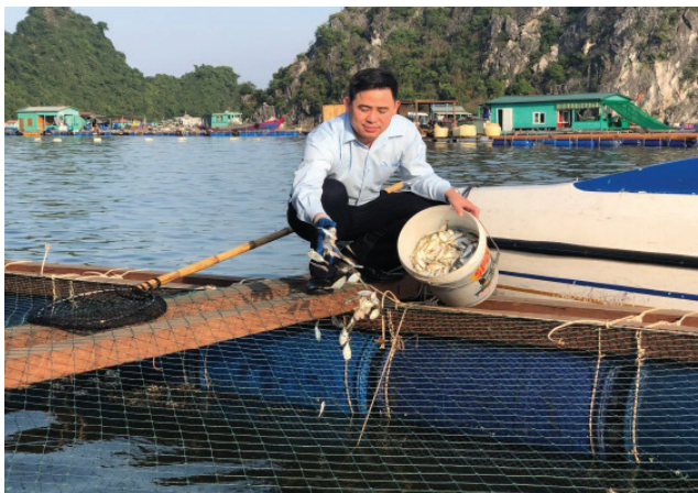
Hình 1: Lồng bè mô hình nuôi biển của chủ tàu lưới kéo

- Thức ăn được sử dụng là cá tạp 50% và thức ăn công nghiệp 50% dạng viên; ngày cho ăn hai lần vào sáng sớm và chiều tối. Quá trình chăm sóc được thực hiện chặt chẽ kiểm tra, giám sát,