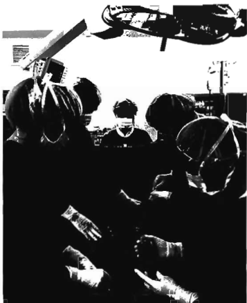
Chép tế bào gốc cho bệnh nhân xơ gan.

Cho tới nay, tế bào gốc đã được ứng dụng trong việc điều trị các bệnh sau: tiểu đường, viêm đa khớp, Parkinson, Alzheimer, viêm xương khớp, tai biến mạch máu não và chấn thương sọ não, khuyết tật do rối loạn bẩm sinh, tim thường tủy sống, thiếu máu cơ tim, trị liệu ung thư, hồi, thay thế răng bị mất, hạn chế thính giác, phục hồi thị lực và sửa chữa hư hỏng cho giác mạc, xơ cứng động mạch, bệnh Crohn, chữa lành vết thương, chữa vô sinh do thiếu tế bào gốc tinh trùng. Ngoài ra, nhiều nghiên cứu đang được tiến hành nhằm phát triển các nguồn tế bào gốc khác nhau,