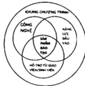
Sơ đồ 1. Mô hình hóa học tập hòa nhập dành cho sinh viên khiếm thị

cho sinh viên khiếm thị tại Trường Đại học Ngoại ngữ bằng sơ đồ dưới đây, trong đó chương trình khung bao trọn bên ngoài không thay đổi và phần giao thoa chính là sản phẩm đào tạo.