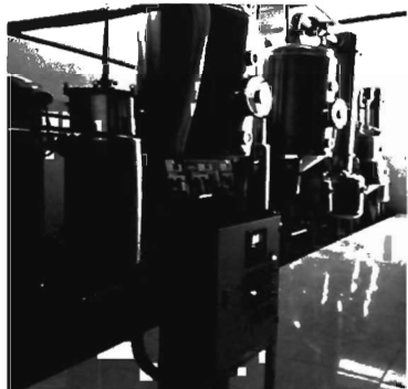
Hệ thống chiết xuất cao dược liệu đang được vận hành tại Công ty Cổ phần chè Shan Tuyết.

với các tiêu chuẩn quy định hiện hành và đáp ứng đầy đủ các yêu cầu về tiêu chuẩn xuất khẩu của thị trường châu Âu. Đặc biệt, hệ thống được thiết kế, chế tạo phù hợp với điều kiện công nghệ trong nước, tương thích với nhiều hệ thống thiết bị chiết xuất dược liệu tại các cơ sở sản xuất thuốc và chế biến dược liệu hiện có. Đây là cơ sở quan trọng để nâng cấp hệ thống thiết bị chiết xuất cao dược liệu sản cơ của các cơ sở sản xuất thuốc và chế biến dược liệu trong nước nhằm nâng cao chất lượng sản phẩm, đáp ứng yêu cầu công nghệ sản xuất trong thời gian tới.