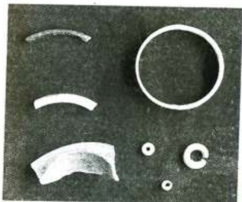
Hình 1. Vòng tay và khuyên tai đá [5]

Quan sát hình 26. Vòng tay và khuyên tai đá trang 28 (tương đương với hình 1 trong bài báo) và trả lời những câu hỏi sau: