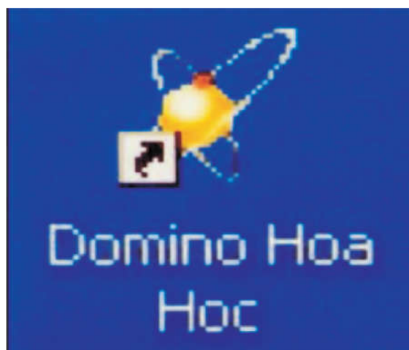
Hình 1: Logo Chương trình máy tính V2.0

Chương trình máy tính V2.0 là phần mềm dạy học hóa học hữu cơ (HHHC) có trí tuệ nhân tạo (PMV2.0) được thiết kế lập trình trên môi trường DOTNET và sử dụng ngôn ngữ VBNET; với nguyên lý “giáo dục lập trình hóa gắn với tự động hóa” trí tuệ nhân tạo của PMV2.0 được xây dựng dựa trên chức năng