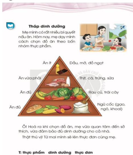
Hình 3. Bài học Tháp dinh dưỡng

Bên cạnh hướng dẫn HS tiểu học cần có khả năng tự chăm sóc bản thân, biết nấu ăn, làm bánh... các tác giả cũng đã đưa vào SGK các bài học giúp các em HS cần biết cách phân biệt những loại thực phẩm an toàn và những loại có hại cho sức khỏe, đồng thời biết ăn đa dạng các loại thực phẩm để đủ chất cho sự phát triển của cơ thể. Ví dụ: bài Tháp dinh dưỡng [5, tr.99] (Hình 3).