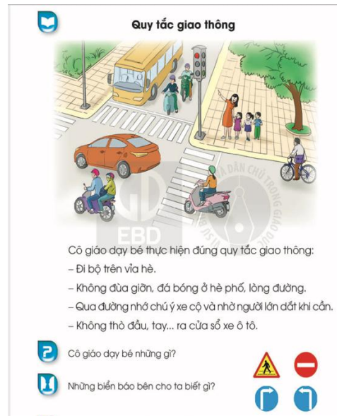
Hình 4. Bài học Quy tắc giao thông

Các bài học về những quy tắc an toàn giao thông cho trẻ cũng rất quan trọng đối với các em HS. Phòng ngừa và thận trọng là chìa khóa quan trọng trong việc giáo dục các em tham gia giao thông an toàn. Bởi vậy, trong SGK, các tác giả đã hướng dẫn cho các em HS lớp 1 hiểu về Quy tắc giao thông [4, tr.189] (Hình 4).