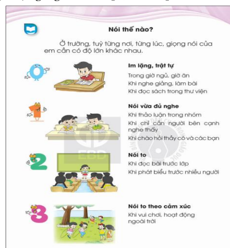
Hình 2. Bài học Nói thế nào?

Bài học Nói thế nào? (Hình 2) giúp học sinh biết cách nói khi: Ở trường, tùy từng nơi, từng lúc, giọng nói của em cần có độ lớn khác nhau. Im lặng, trật tự trong giờ ngủ, giờ ăn; khi nghe giảng bài, làm bài; khi đọc sách trong thư viện. Nói vừa đủ nghe khi thảo luận trong nhóm, khi chỉ cần người bên cạnh nghe thấy, khi chào hỏi thầy cô và các bạn. Nói to khi đọc bài trước lớp, khi phát biểu trước nhiều người. Nói to theo cảm xúc khi vui chơi, hoạt động ngoài trời [5, tr.108].