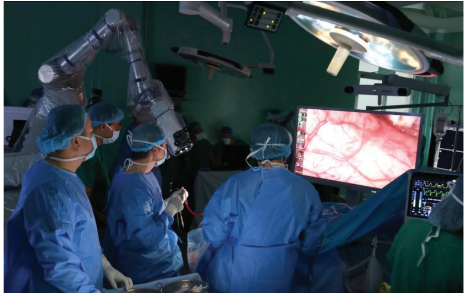
Bệnh viện Nhân dân 115 áp dụng Robot thần kinh Modus V Synaptive trong phẫu thuật.

Robot thần kinh Modus V Synaptive được ứng dụng phẫu thuật tại Mỹ, Canada từ năm 2015 (robot thế hệ I), được tích hợp chụp cộng hưởng từ khuếch tán sức căng, tự động xử lý để nhìn thấy các bó thần kinh, tùy chỉnh tối ưu cách tiếp cận tổn thương trong phẫu thuật, lập kế hoạch phẫu thuật, định hướng phẫu thuật, vận hành nhanh, chính xác hơn, phẫu trường mổ