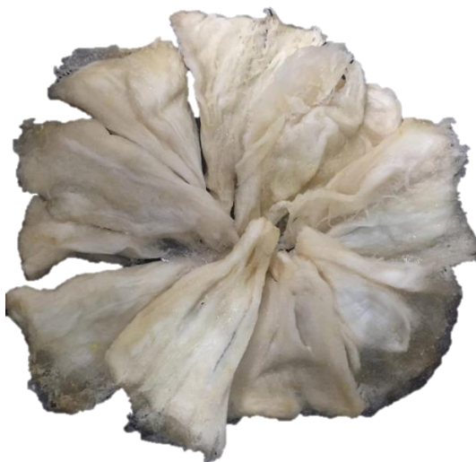
Hình 3.3 Sản phẩm Mãng cầu xiêm sấy dẻo[17]