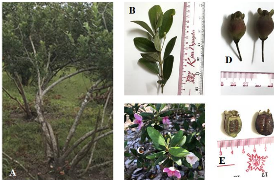
Hình 1 Đặc điểm hình thái thân (A), lá (B), hoa (C), quả (D), và hạt (E) của cây Hồng sim