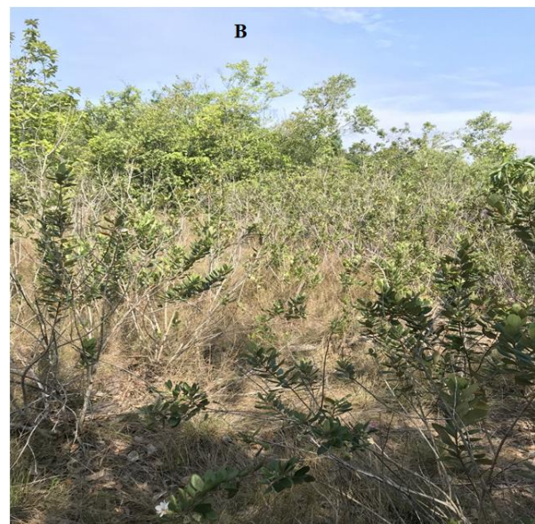
Hình 2 Định vị khu bảo tồn (A) và hệ sinh thái cây Hồng sim (B) mọc tự nhiên trong Vườn Quốc gia Phú Quốc