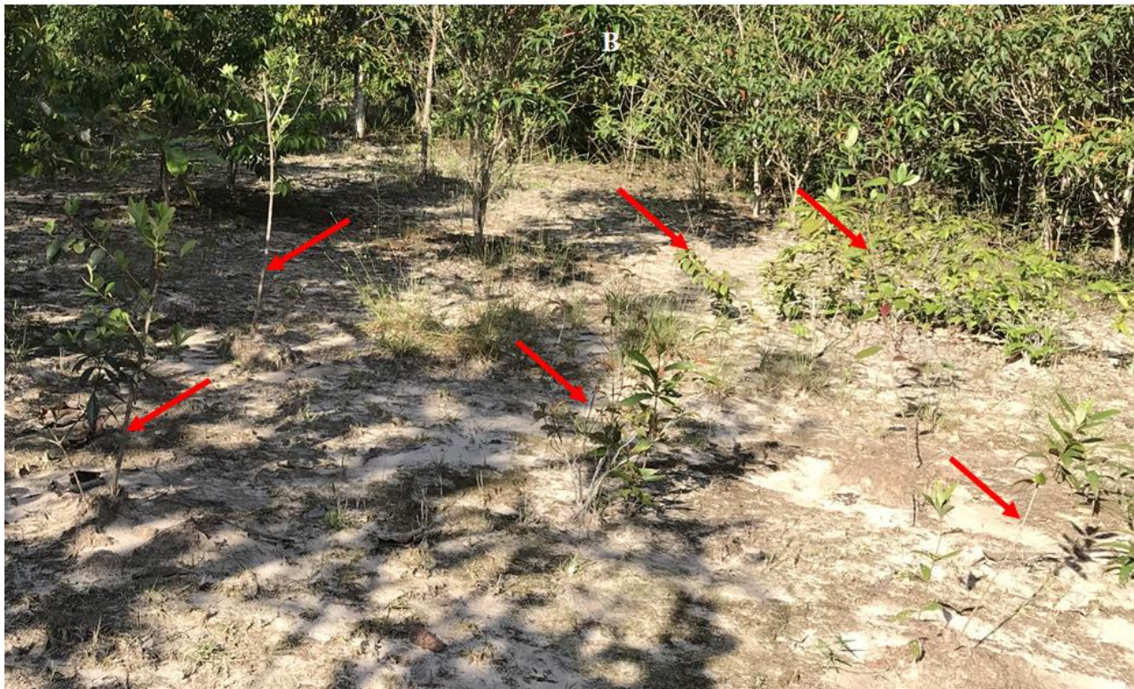
Hình 3 Định vị (A) và hệ sinh thái cây Hồng sim (B) được trồng mới trong Vườn Quốc gia Phú Quốc