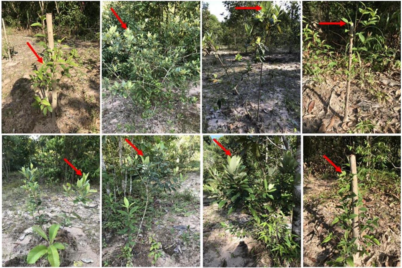
Hình 4 Cây Hồng sim sinh trưởng sau khi trồng 6 tháng tại Vườn Quốc gia Phú Quốc