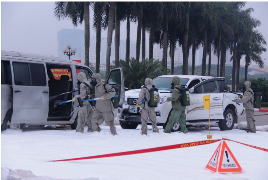
Diễn tập ứng phó sự cố an toàn bức xạ và hạt nhân năm 2019.

nâng cao hiệu quả quản lý nhà nước về KH&CN, đáp ứng yêu cầu, nhiệm vụ trong giai đoạn mới.