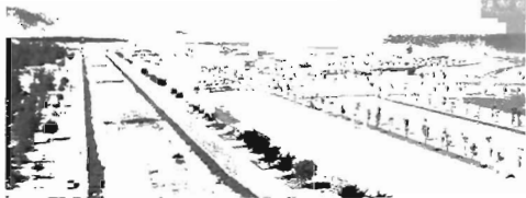
Tuyên Quốc lộ 19B đang được gấp rút hoàn thành, nâng cao năng lực kết nối của Khu Kinh tế Nhơn Hội với trung tâm TP. Quy Nhơn và sân bay Phù Cát

Hoài Ân, An Lão (chỉ thu hút 1 đến 2 dự án đầu tư trong năm qua).