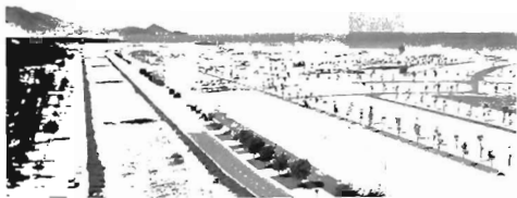
Tuyến Quốc lộ 19B đang được gấp rút hoàn thành, nâng cao năng lực kết nối của Khu kinh tế Nhơn Hội với trung tâm TP. Quy Nhơn và sân bay Phú Cát

Hoài Ân, An Lão (chỉ thu hút 1 đến 2 dự án đầu tư trong năm qua).