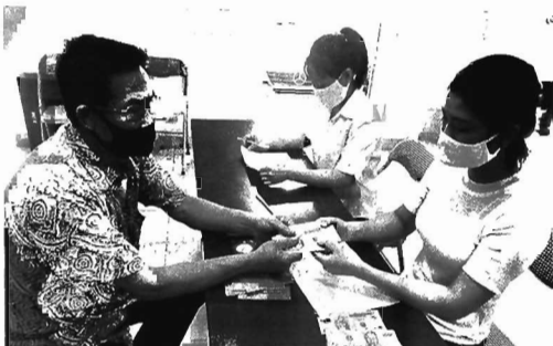
Người dân phường Phúc Diễn (Bắc Từ Liêm - Hà Nội) nhận tiền hỗ trợ từ gói cứu trợ 62.000 tỷ đồng của Chính phủ

Để hỗ trợ NLD bị ảnh hưởng từ Covid-19, Chính phủ đã đưa ra gói cứu trợ 62.000 tỷ đồng, và dự kiến có khoảng 20 triệu người thuộc 7 nhóm đối tượng thụ hưởng, như: người có công với cách mạng đang hưởng chính sách ưu đãi hàng tháng; đối tượng bảo trợ xã hội; hộ nghèo, hộ cận nghèo; NLD theo chế độ hợp đồng phải tạm hoãn hợp đồng lao động; nghỉ không hưởng lương; NLD bị chấm dứt hợp đồng không đủ điều kiện hưởng bảo hiểm thất nghiệp, NLD tự do, không có giao kết hợp đồng... Đây là biện pháp hỗ trợ trực tiếp của Chính phủ cho NLD để ổn định sinh kế trong thời gian dịch bệnh. Bên cạnh đó, Chính phủ cũng đã có chính sách cho DN vay với lãi suất 0% để trả lương và Ngân hàng Chính sách xã hội sẽ trả trực tiếp vào tài khoản của NLD (Chính phủ, 2020).