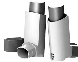
Hình 5. BXĐL có bộ đếm liều