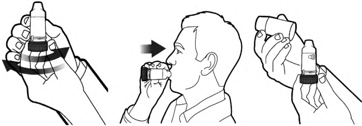
Hình 2. Các bước sử dụng ống hít Turbuhaler