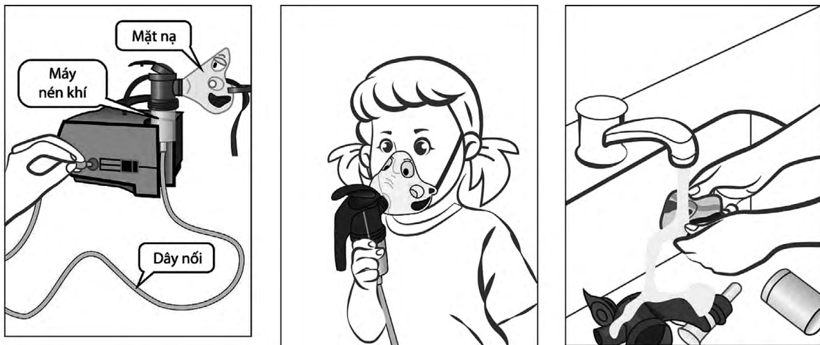
Hình 4. Các bước sử dụng máy phun khí dung khí nén

1.3.4. Quy trình sử dụng máy phun khí dung khí nén [9]