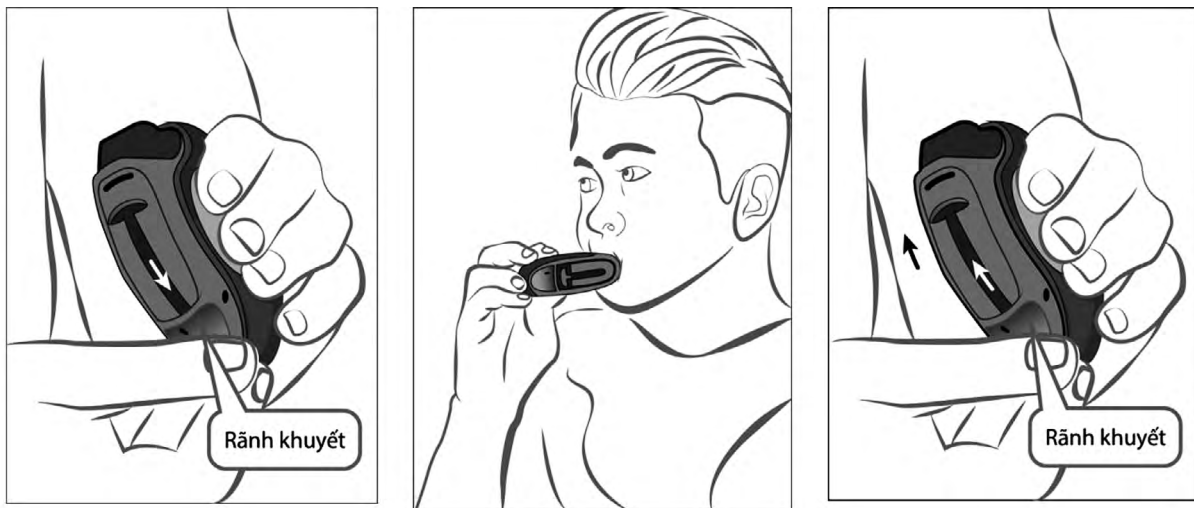
Hình 3. Các bước sử dụng đĩa hít Diskus

Bước 1: Một tay cầm đĩa hít, đặt ngón cái tay kia ở rãnh khuyết, đẩy rãnh khuyết cho đến khi nghe tiếng "cắc", sẽ thấy đầu ngậm.