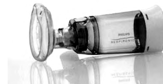
Hình 7. Buồng đệm kèm mặt nạ

- Đa số buồng đệm nhựa đều có hiện tượng tích điện làm cho các hạt khí dung bám vào mặt trong buồng đệm, ít vào đường thở hơn. Để tránh hiện tượng này, có thể rửa buồng đệm bằng nước xà phòng pha loãng [2].