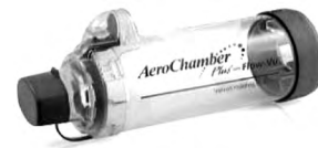
Hình 6. Buồng đệm kèm ống ngậm