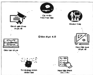
Hình 1: Mô hình giáo dục

Trong bối cảnh của cuộc Cách mạng công nghiệp 4.0, mô hình giáo dục đại học cũng dần thay đổi. Mô hình quản trị đại học thông minh được xây dựng dựa trên ứng dụng các mô hình tiên tiến với các đặc trưng tiêu biểu