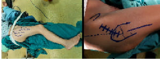
Hình 1. Tư thế và đường mổ bệnh nhân

đường định hướng. Sau khi rạch da, bóc tách vào bao khớp trước thông qua vách gian cơ của cơ căng mạc đùi và cơ mỏng nhỡ. Mở bao khớp theo hình chữ H (có thể bảo tồn hoặc cắt bỏ một phần bao khớp trước), cắt cổ xương đùi theo 2 đường cắt (một đường cắt sát chỏm, một đường cắt ở nền cổ).