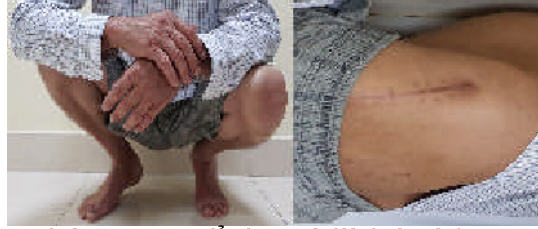
Hình 3. Sẹo mổ và tư thế bệnh nhân sau mổ thay khớp háng trái 1 tháng

chế tổn thương đến các cấu trúc phần mềm quanh khớp, do đó giúp bệnh nhân nhanh chóng hồi phục và sớm đạt được các chức năng vận động bình thường như trước mổ.