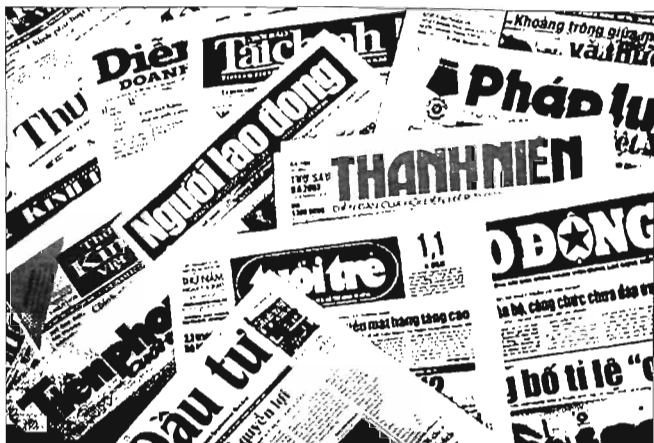
Báo chí, truyền thông có vai trò quan trọng trong việc xây dựng, củng cố niềm tin xã hội

cây vào chính hệ thống xã hội. Chính vì thế, để củng cố và tăng cường niềm tin trong xã hội, chính quyền các tỉnh thành Trung Bộ không thể không chú trọng đến việc định hướng phát triển cho các lĩnh vực của truyền thông trên tinh thần tự do, cởi mở và trung thực.