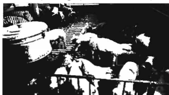
Hình 3. Nuôi lợn thịt trên chuồng sản không sử dụng nước vệ sinh và làm mát lợn

* Tuổi thọ chuồng trại tối thiểu là 10 năm, lãi suất vay nông nghiệp r = 12\% / năm, nuôi lợn 2 lứa / năm