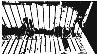
Hình 1. Máng uống nước được thử nghiệm trong mô hình

Sử dụng loại cốc uống phù hợp thay thế cho nùm uống giúp giảm lượng nước rơi vãi khi lợn uống so với nùm uống thông thường người dân đang sử dụng phổ biến (làm đối chứng). Sử dụng đồng hồ đo nước để đo lượng nước tiết kiệm được.