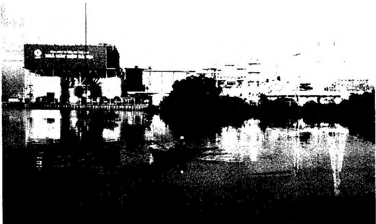
Ioan cảnh Nhà máy Nhiệt điện Bà Rịa.

Hoạt động sản xuất - kinh doanh ổn định, hiệu quả và có lãi; bảo toàn và phát triển vốn của các cổ đông, nâng cao đời sống vật chất, tinh thần cho người lao động là những kết quả mà Công ty CP Nhiệt điện Bà Rịa đạt được trong thời gian qua.