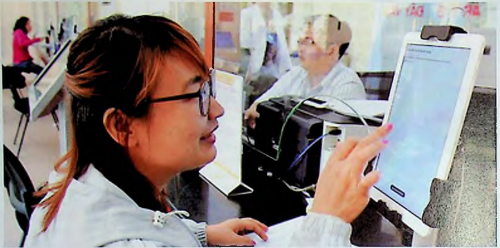
Người dân đánh giá chất lượng phục vụ tại UBND quận Bình Thạnh, Thành phố Hồ Chí Minh.

Đảng bộ Thành phố Hồ Chí Minh trong sạch, vững mạnh, trong thời gian tới, cần tập trung thực hiện một số nhiệm vụ trọng tâm sau: