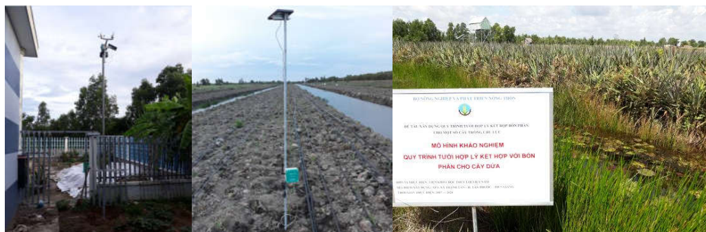
Hình 3: Hình ảnh mô hình dưa Tiền Giang

Ghi chú: Trong bảng trên, quy đổi ra ha trên cơ sở mật độ 40.500 gốc/ha của mô hình.