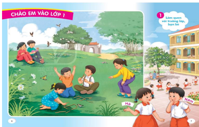
[7, tr. 6,7]