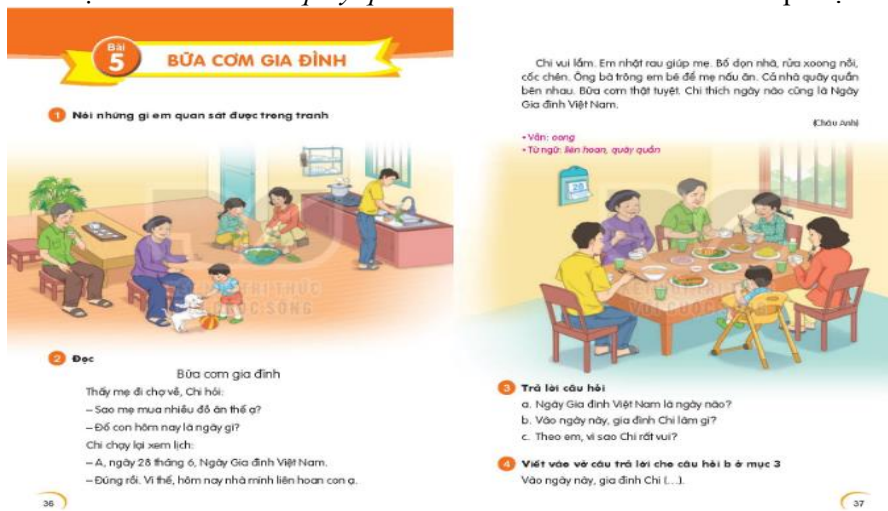
Hình 7. Bữa cơm gia đình

SGK - như tên gọi của nó, là công cụ để giáo dục. Trong các mục tiêu giáo dục, cần khẳng định, SGK đóng vai trò đáng kể trong việc xây dựng các chuẩn xã hội và hình thành cách nhìn về xã hội ở HS. Như vậy, có thể nói, giáo dục bình đẳng giới trong nhà trường là cánh cửa đầu tiên của việc thực hiện bình đẳng giới mang ý nghĩa xã hội. Là công cụ giáo dục quan trọng, SGK nói chung, SGK Tiếng Việt 1 Kết nối tri thức với cuộc sống nói riêng cũng đồng thời phải là công cụ của sự biến đổi xã hội. Mặc dù bình đẳng giới không phải là một phạm trù dễ hiểu đối với HS tiểu học, nhưng việc giáo dục bình đẳng giới với mức độ và phương pháp phù hợp là cần thiết và có thể thực hiện được ngay từ khi HS mới bước chân vào lớp Một.