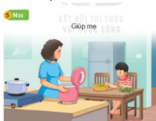
[7, tr. 61]

trợ họ còn phải lao động kiếm sống và tham gia các công việc xã hội. Các tác giả SGK Kết nối tri thức với cuộc sống đã thực sự chú ý đến vấn đề này. Ví dụ: