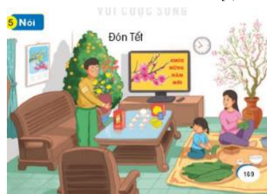
[8, tr. 169]