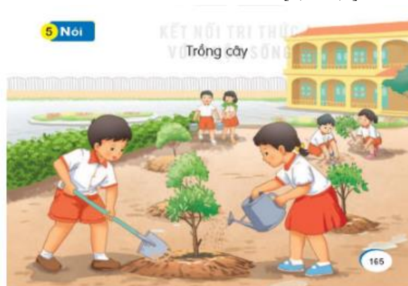
[7, tr. 165]

Bất cứ một trang sách nào có miêu tả hoạt động của tập thể, nhóm, dù là đang học tập trong lớp học hay đang vui chơi, lao động, hoạt động ngoài trời thì các tác giả đều chú ý đến việc cân đối hài hòa giữa số lượng các nhân vật nam và nữ. Hình ảnh minh họa sử dụng trong SGK hấp dẫn, hữu ích, không mang tính định kiến giới và phù hợp cho cả HS nam và HS nữ. Việc xây dựng môi trường lớp học, trường học thân thiện, an toàn, bình đẳng là một trong các yếu tố cơ bản đáp ứng các quyền con người cơ bản của HS; giúp HS mỗi ngày đến trường đều được vui vẻ, được tôn trọng và cảm thấy hạnh phúc, an toàn trong môi trường học đường.