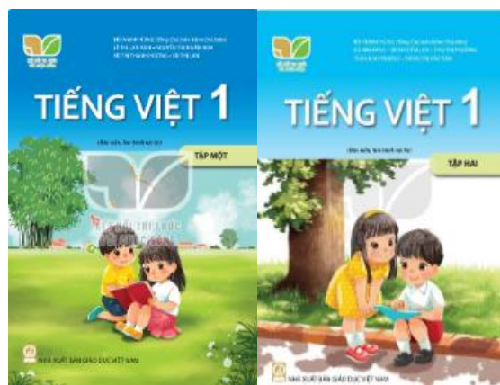
Hình 2. Bìa sách Tiếng Việt 1 - Kết nối tri thức với cuộc sống

Nội dung thông tin trong một cuốn SGK thường được giới thiệu, thể hiện qua hai hình thức: qua văn bản (ngôn ngữ) và qua hình thức phi ngôn ngữ (ảnh, tranh, sơ đồ, bảng biểu). SGK tiểu học từ lớp 1 đến lớp 5 ở Việt Nam cũng được cấu trúc theo mô hình truyền thống này. Ý thức được nội dung quan trọng về bình đẳng giới nên ngay từ khâu tổ chức biên soạn, các tác giả SGK Tiếng Việt 1, bộ sách Kết nối tri thức với cuộc sống đã chú ý đến việc xây dựng, lựa chọn ngữ liệu và hình ảnh, sao cho trong các nội dung và hình ảnh trong bài học luôn cân đối, hài hòa giữa các tuyến nhân vật nam và nữ. Điều đó được thể hiện ngay trên trang bìa cuốn sách.