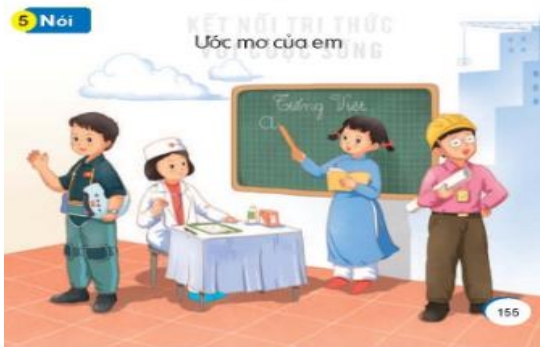
Hình 4. Ước mơ của em

Ví dụ: hoạt động luyện nói “Ước mơ của em” (Hình 4) [7, tr. 155].