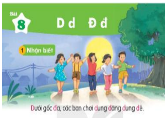
[7, tr. 28]