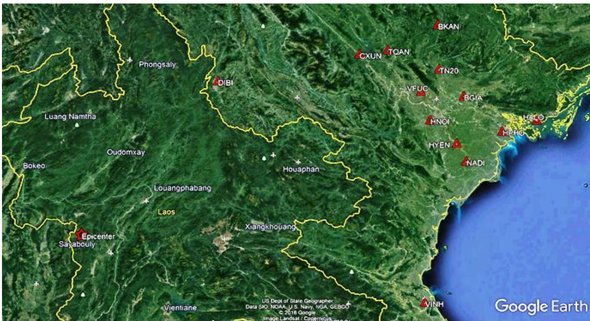
Hình 1. Vị trí tâm chấn của động đất (*) và các trạm CORS (Δ) dùng trong nghiên cứu.

Theo Bảng 1, trạm CORS gần nhất là Điện Biên cách tâm chấn khoảng 277 km, trạm xa nhất ở Hạ Long có khoảng cách đến tâm chấn hơn 600 km.