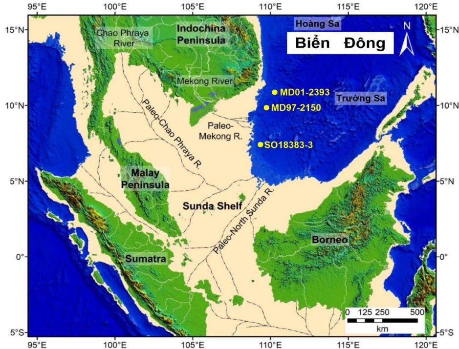
Hình 1. Hình ảnh đường bờ hiện tại và thời kỳ băng hà cực đại cuối cùng ( the Last Maximum Glaciation ) tương ứng với mực nước biển thấp hơn mức hiện nay ~116 m ở phía nam biển Đông (Hanebuth và nnk., 2011; Jiwarungrueangkul và nnk., 2019). Các dòng sông cổ thể hiện hệ thống sông khi nước biển ở mức thấp (Voris, 2000; Sathiamurthy và Voris, 2006).