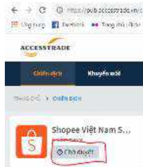
Hình 6. Trạng thái chờ duyệt

Hệ thống sẽ xem xét và duyệt đăng ký chiến dịch sau 1 đến 2 ngày. Chiến dịch được duyệt có nghĩa là đã sẵn sàng để thực hiện tiếp thị liên kết.