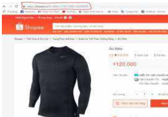
Hình 8. Công cụ tạo link

Copy link sản phẩm sau khi tìm và lựa chọn trên Shopee.vn (hình 8) và dán vào thanh URL của công cụ tạo link (hình 9).