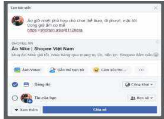
Hình 10. Đăng bài lên website

Đăng bài lên website cá nhân hoặc các trang mạng xã hội và đính kèm link liên kết trong bài viết. Tại bài báo này, tác giả chọn mạng xã hội facebook để tiến hành đăng bài và marketing (Hình 10).