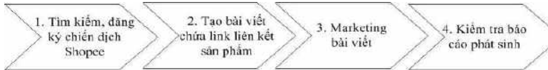
Hình 2. Hình thể hiện các bước thực hiện tiếp thị liên kết cho Công ty TNHH Shopee