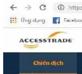
Hình 3. Giao diện modul chiến dịch

Bước 1.1. Tại giao diện publisher click vào modul “Chiến dịch”(Hình 3)