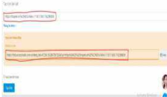
Hình 9. Lấy link

Bước 2.4: Click vào tạo link để lấy link làm tiếp thị (hình 9).