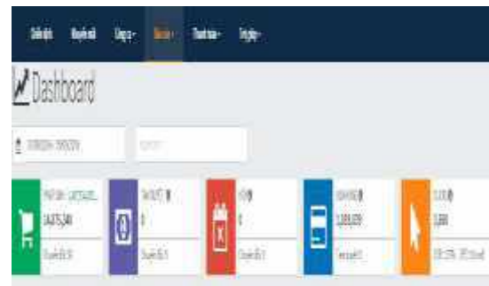
Hình 11. Thống kê các báo cáo phát sinh

Tùy theo khoảng thời gian hoặc theo từng chiến dịch, đối tác có thể kiểm tra các báo cáo phát sinh bao gồm: Doanh thu chuyển đổi và đơn hàng phát sinh, số đơn hàng và doanh thu bị hủy, hoa hồng chuyển đổi ở trạng thái chờ duyệt và số lượng Click hệ thống ghi nhận được...(Hình 11).