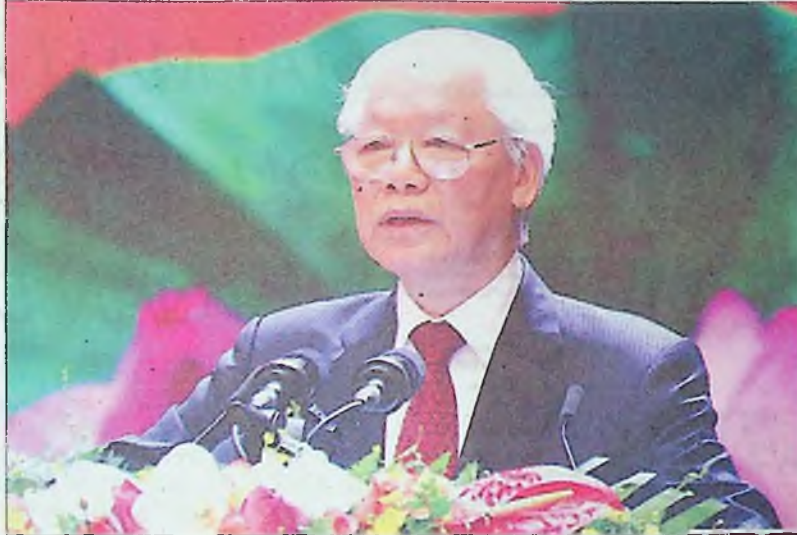
Tổng Bí thư, Chủ tịch nước Nguyễn Phú Trọng phát biểu tại Lễ kỷ niệm cấp Quốc gia 50 năm thực hiện Di chúc của Chủ tịch Hồ Chí Minh.

Văn nghệ xin trân trọng trích giới thiệu một phần nội dung bài phát biểu quan trọng này.