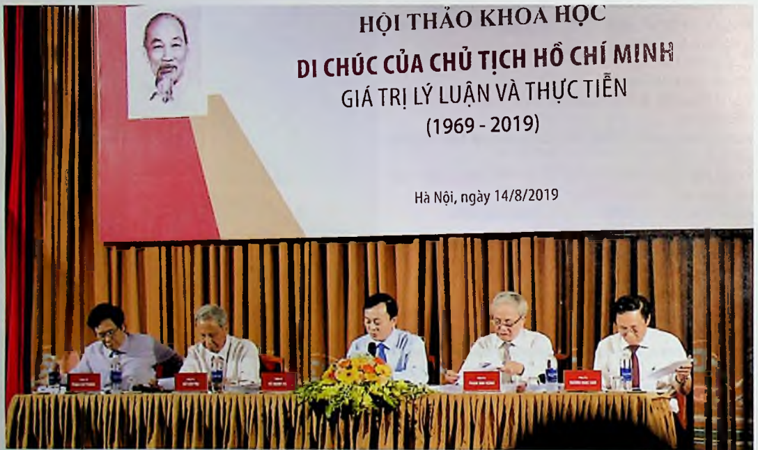
Đoàn Chủ tịch Hội thảo

"50 năm đã trôi qua, thời gian càng lùi xa, chúng ta càng thêm thấu hiểu và cảm phục trí tuệ sáng suốt phi thường của Người. Cảm phục tầm nhìn và sự lo xa của Người. Liệu có ai đã hiểu hết được việc Bác "viết sẵn và để lại mấy lời này" lại trở nên quan trọng với toàn Đảng và toàn dân ta đến vậy...", nguyên Ủy viên Bộ Chính trị, nguyên Bí thư Thành ủy Hà Nội Phạm Quang Nghị viết.