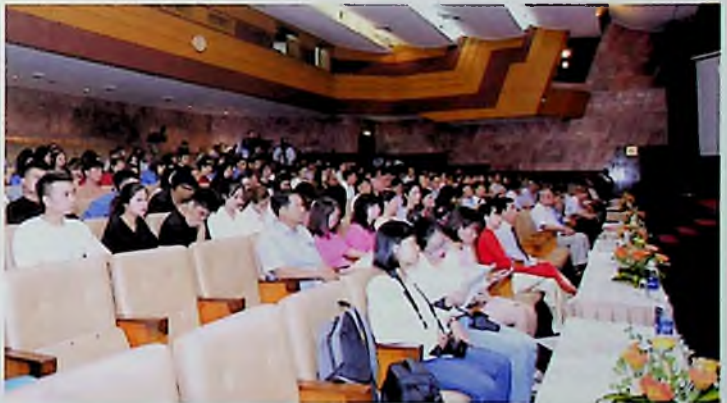
Các đại biểu dự Hội thảo