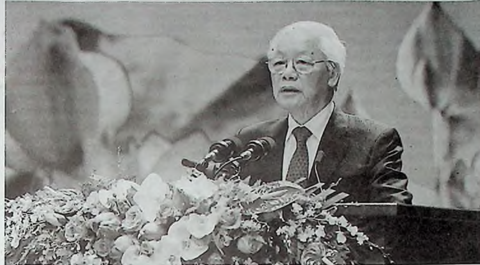
Tổng bí thư, Chủ tịch nước Nguyễn Phú Trọng phát biểu tại lễ kỷ niệm

Tổng bí thư, Chủ tịch nước Nguyễn Phú Trọng nhấn mạnh, Chủ tịch Hồ Chí Minh không chỉ là một nhà tư tưởng lỗi lạc, mà còn là nhà tổ chức thiên tài, đã sáng lập, lãnh đạo và rèn luyện Đảng ta, là người thầy vĩ đại của cách mạng VN - Anh hùng giải phóng dân tộc, Danh