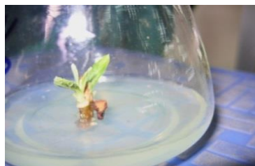
Hình 1. Chồi Téch sau khi khử trùng và nuôi cấy 30 ngày