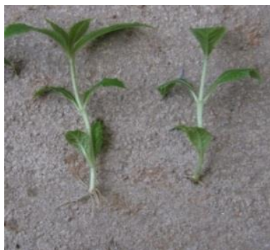
Hình 4. Chồi Téch nuôi cấy ra rễ có bổ sung 0,75 mg/L IBA hai dòng VN34, VN19

Từ dẫn liệu bảng 5, ta thấy IBA có ảnh hưởng rõ đến tỷ lệ ra rễ, số rễ trung bình/cây và chiều dài trung bình của rễ. Tỷ lệ ra rễ và số rễ trung bình trên cây tăng rất nhiều khi bổ sung với nồng độ 0,5 - 0,75 mg/l, các chỉ tiêu theo dõi đạt cao nhất ở nồng độ 0,75 mg/l. Dòng VN34: TLRR: 78,28 \pm 1,37 (%), CDR: 6,15 \pm 0,10 (cm); số rễ trung bình/cây (SRTB): 5,67 \pm 0,12 (rễ); VN19: 77,35 \pm 1,19 (%), SRTB: 6,33 \pm 0,23 (cm), CDR: 5,71 \pm 0,20 (rễ). Nhưng số rễ TB cao nhất là dòng VN19, ở nồng độ 0,75 mg/l là 5,71 \pm 0,20 (rễ). Nồng độ IBA tăng ở các nồng độ 1,0 nhưng các chỉ tiêu trên lại giảm, chất lượng chồi xấu như: Rễ ngắn, phình to, có màu trắng đục, số rễ trên chồi ít. Nghiên cứu cho thấy, bổ sung chất kích thích ra rễ ở nồng độ cao sẽ gây ức chế đến khả năng ra rễ và chất lượng rễ của hai dòng Téch VN34, VN19. Theo báo cáo của R. Sreedevi and. T. Damodharam, 2015 [4], cho thấy môi trường sử dụng 1,5 mg/l IBA cho tỷ lệ ra rễ cao nhất đạt 100%, số lượng rễ/ chồi: 7,4 \pm 0,11 (rễ); chiều dài rễ: 9,7 \pm 0,15 (cm). Bên cạnh đó công bố của Evandro V. Tambaruss et al. (2017) [2], khi sử dụng 0,5-1,0 mg/l sau 2 tuần nuôi cấy đạt tỷ lệ ra rễ là 65% và hoàn thành ra rễ trong vòng 6 tuần. Tương tự như vậy Shirin et al. (2005) [3], khi sử dụng nồng độ chất kích thích ra rễ là IBA nồng độ 2,6 mg/l đạt tỷ lệ ra rễ là 66%.