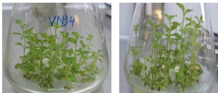
Hình 2. Chồi nuôi cấy có bổ sung BAP 0,75mg/l của hai dòng VN34, VN19

(Trong đó: +. Sinh trưởng kém, ++. Sinh trưởng trung bình, +++. Sinh trưởng tốt, chồi mập, cao, lá đều)