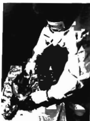
Hình 3. Kiểm tra gà nghi ND