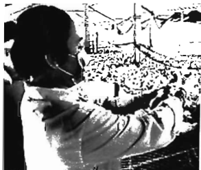
Hình 2. Chủng ngừa vaccin ND cho gà