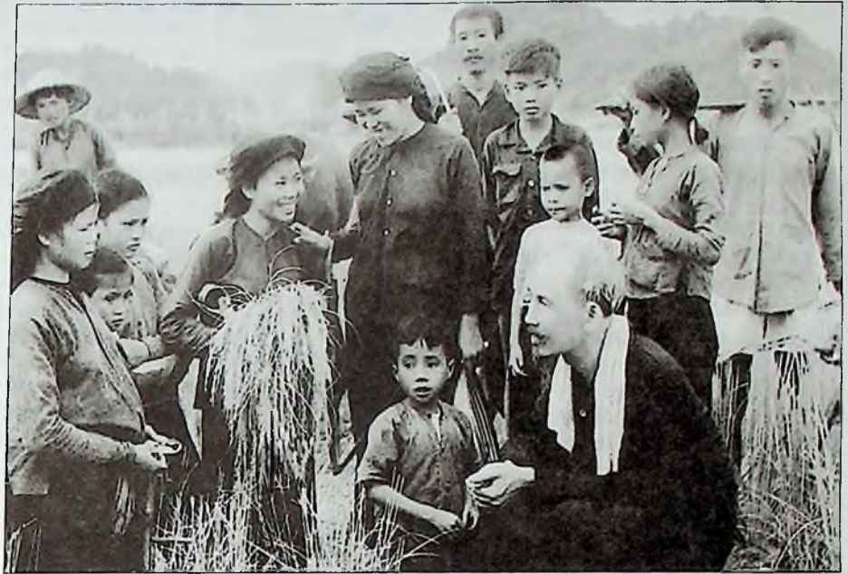
Bác Hồ thăm hỏi tình hình sản xuất của bà con xã viên

Từ "lo cái ăn" đến đảm bảo an ninh về lương thực; với "Khoản 10" nông nghiệp đã làm tròn trọng trách lo đủ "cái ăn" cho đất nước và từ năm 1989, có