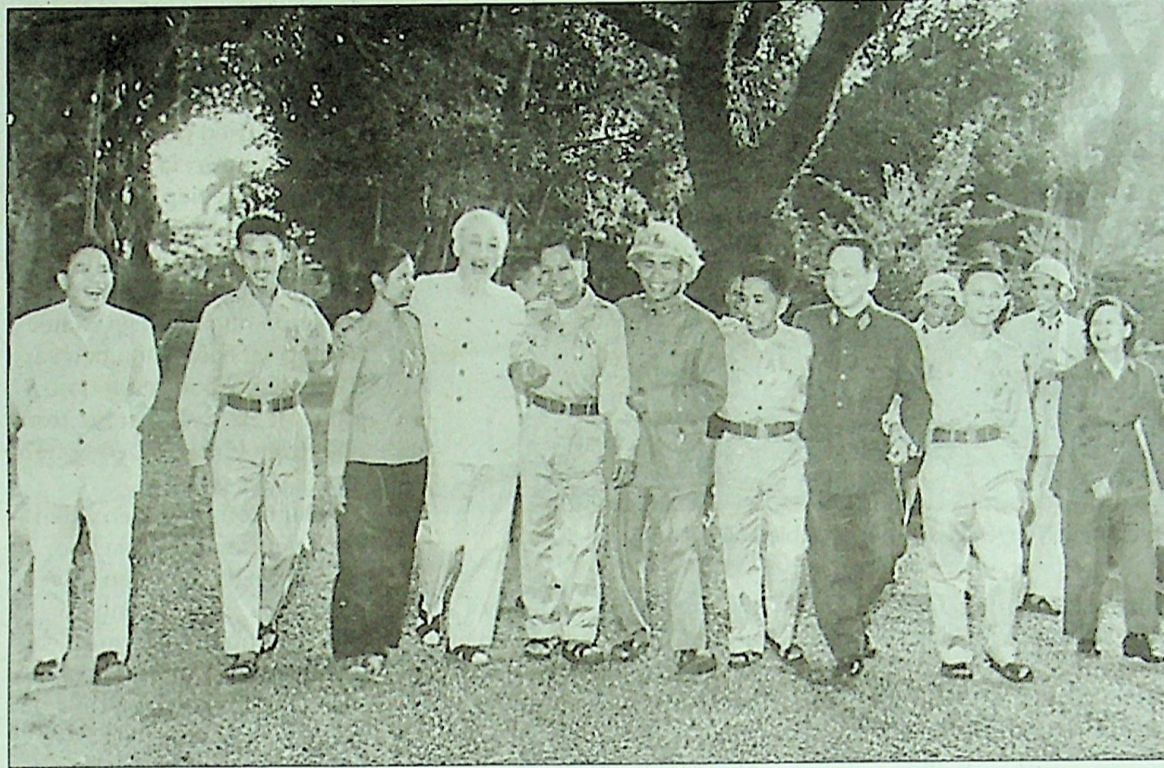
Bác Hồ với các anh hùng và chiến sĩ thi đua miền Nam, tháng 11/1965.

Thực hiện Di chúc của Người, trải qua 9 kỳ Đại hội Đảng, kể từ Đại hội IV đến Đại hội XII, Đảng ta đã xác định rõ hơn những quan niệm về chủ nghĩa xã hội và về con đường