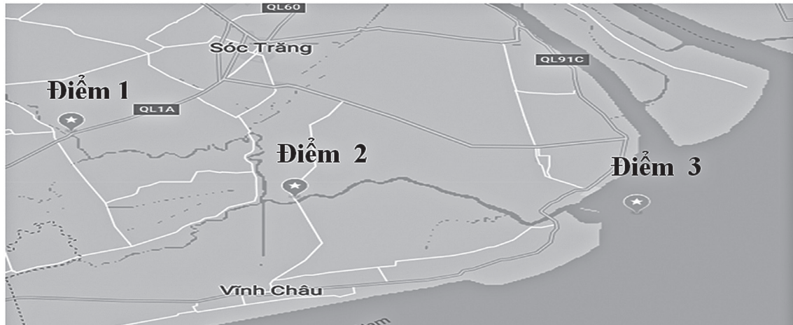
Hình 1. Các điểm thu mẫu dọc theo tuyến sông Mỹ Thanh (nguồn: Google map, 2019).

không chỉ các loài cá tôm mà cả với các loài sinh vật nhỏ khác. Nhóm động vật phiêu sinh là thức ăn quan trọng trong chuỗi thức ăn của ĐVTS. Ngoài ra, chúng có thể được sử dụng làm sinh vật chỉ thị cho môi trường giàu dinh dưỡng do chúng có đặc điểm vòng đời ngắn, phát triển nhanh và phản ứng nhanh với sự thay đổi của điều kiện môi trường. Vì vậy, chúng được xem là loài có giá trị rất lớn trong chỉ thị chất lượng nước (Gannon & Stemberger, 1978;