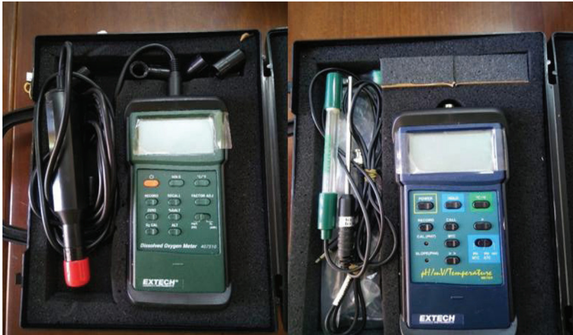
Hình 1. Máy Dissolved Oxygen Meter 407510 và máy pH/mV/Temperature Meter

Cá được ngưng cho ăn 1 ngày trước khi thu