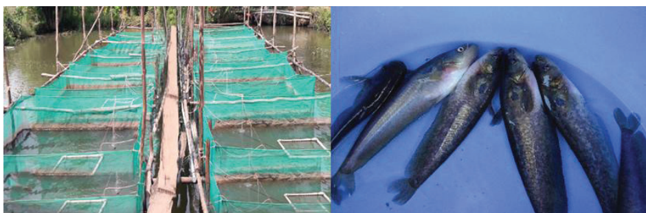
Hình 1. Giai lưới và cá trên bầu nuôi vỗ thành thực trong thí nghiệm

Đối tượng nghiên cứu là cá trên bầu ( O. bimaculatus ). Nghiên cứu được thực hiện tại trại thực nghiệm Thủy sản, Khoa Nông nghiệp – Tài nguyên thiên nhiên, trường Đại Học An Giang. Hệ thống thí nghiệm trong giai lưới (3x2x2) m, kích thước mắt lưới là 1,0 cm, đặt trong ao có diện tích 500 m 2 , sâu 1,5 - 2,0 m. Cá thí nghiệm có kích cỡ tương đối đồng nhất và khỏe mạnh, khối lượng từ 25 g/con trở lên, được bắt từ sông Hậu. Thí nghiệm được bố trí ngẫu nhiên hoàn toàn với 4 nghiệm thức thức ăn gồm cá tạp (NT1) và thức ăn viên công nghiệp 30% đạm (NT2), 35% đạm (NT3) và 40% đạm (NT4); mỗi nghiệm thức được lặp lại 3 lần. Mật độ nuôi là 30 con/m 2 với tỷ lệ đực:cái = 1:1 và thời gian nuôi 12 tháng. Việc cho ăn và chăm sóc được tiến hành như sau: giai đoạn hậu bị hoặc sau khi cá sinh sản thì nuôi vỗ tích cực cho ăn 4 – 5% /khối lượng cá /ngày; giai đoạn nuôi vỗ thành thực trước khi cho cá sinh sản 1 tháng cho ăn 2 – 3% /khối lượng cá /ngày đối với thức ăn là cá tạp còn thức ăn viên công nghiệp cho cá ăn bằng 1/2 lượng thức ăn là cá tạp và ngày cho ăn 1 lần lúc 17 giờ. Định kỳ thay nước 7 ngày/lần từ 30% đến 50%.