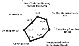
Biểu đồ 2. Mức độ bền vững của các tiêu chí Văn hóa - Xã hội

sự bền vững của nhóm tiêu chí Văn hóa - xã hội là 58,59, đạt mức trung bình. Đây là trạng thái chưa bền vững. Tuy nhiên, hầu hết điểm đánh giá các tiêu chí thành phần đều đạt bền vững nằm ngang từ (61 - 80), đó tiêu chí Tác động bên ngoài đến văn hóa (62,05), Đóng góp kinh tế cho bảo tồn tài nguyên nhân văn (62,24), Ý thức lưu giữ văn hóa dân tộc (66,21) và Đời sống dân cư (72,72). Ngoài ra, tiêu chí Cơ hội giáo dục đạt 85,64 điểm, đây là điểm đạt mức độ trạng thái bền vững. Điều này chứng tỏ, sự phát triển của du lịch đã góp phần nâng cao đời sống văn hóa, xã hội của cộng đồng dân cư, tạo công ăn việc làm, giúp xóa đói giảm nghèo, đóng góp kinh tế cho cộng đồng địa phương trong việc bảo tồn, tôn tạo các di tích, danh lam, thắng cảnh; tạo nhiều cơ hội giáo dục cho cộng đồng cư dân địa phương.