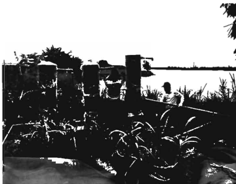
Hình 3. Thử nghiệm hệ thống nhận tin tự động về thời gian chạy máy và thay thế vỏ lọc bằng thép nhập khẩu bằng vật liệu composite