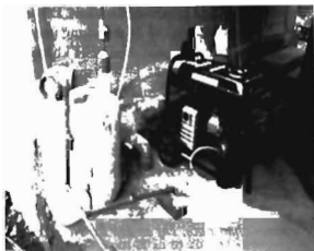
Hình 1. Mô hình máy phát điện KSH chuyên dụng nhập khẩu với công suất 5 kVA tại Lào Cai và 60 kVA tại Bình Định của dự án LCASP

Đã tiến hành điều tra hiện trạng sử dụng máy phát điện KSH tại 10 tỉnh tham gia dự án là Lào Cai, Sơn La, Phú Thọ, Bắc Giang, Nam Định, Hà Tĩnh, Bình Định, Tiền Giang, Bến Tre, Sóc Trăng để thu thập các chỉ số liên quan đến chất lượng, giá thành, hiệu quả kinh tế, môi trường, mức độ tiện dụng.