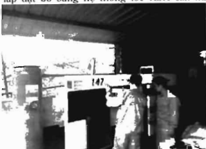
Hình 2. Thử nghiệm máy phát điện KSH cải tạo từ máy phát điện chạy bằng diesel công suất 45 kVA của dự án LCASP tại Nam Định và 100 kVA tại Phú Thọ

trong nước. Thử nghiệm được tiến hành tại Nam Định, theo dõi các chỉ số nhằm đánh giá hiệu quả kinh tế, so sánh với hệ thống phát điện KSH nhập ngoại và đánh giá khả năng thay thế máy phát điện dự phòng chạy diesel bằng máy phát điện KSH.